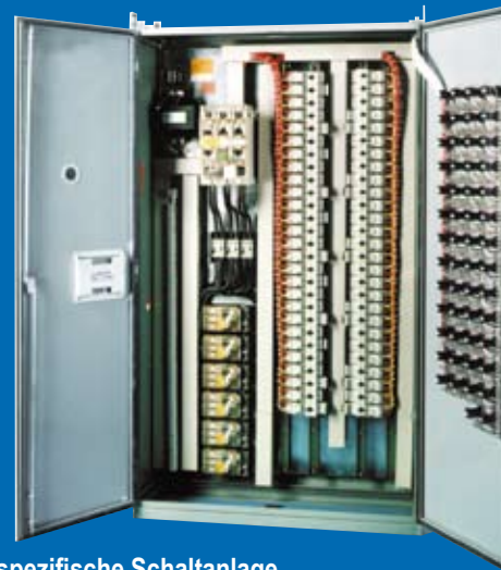
Kundenspezifische Schaltanlage mit mehrfach Motorstartern