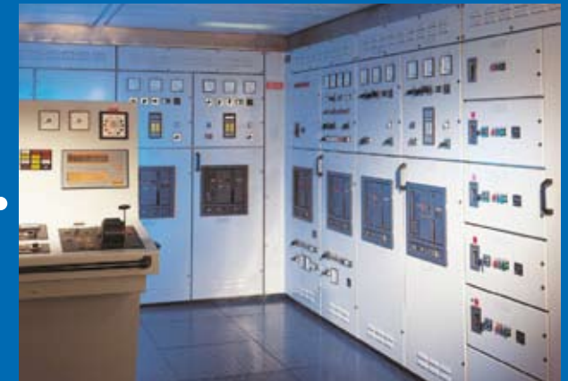
Ecklösung einer Motorsteuerung für eine offshore Anwendung